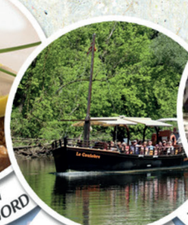
BALADE SUR L'EAU GABARRES DE BEYNAC