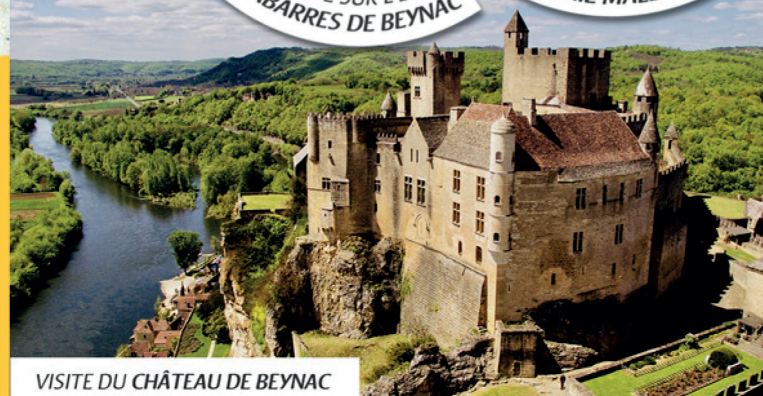
VISITE DU CHÂTEAU DE BEYNAC