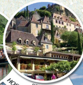
REPAS HOSTELLERIE MALEVILLE